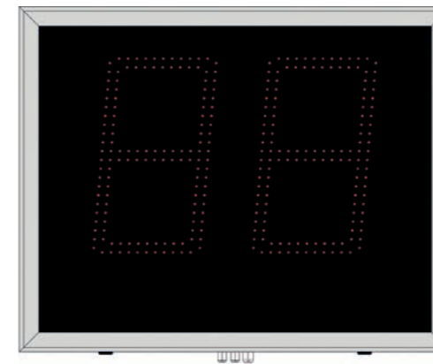
Shot Clock 300 / Play Clock (10003074)

Die Sekundenanzeigen haben eine Zeichenhöhe von 300 oder 450 mm. Sie sind als Paar, aber auch einzeln erhältlich.