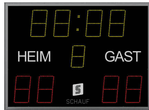
Beispiel: BASE Line 300