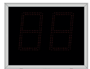
Zusatzmodul Play Clock (s. Seite 12)