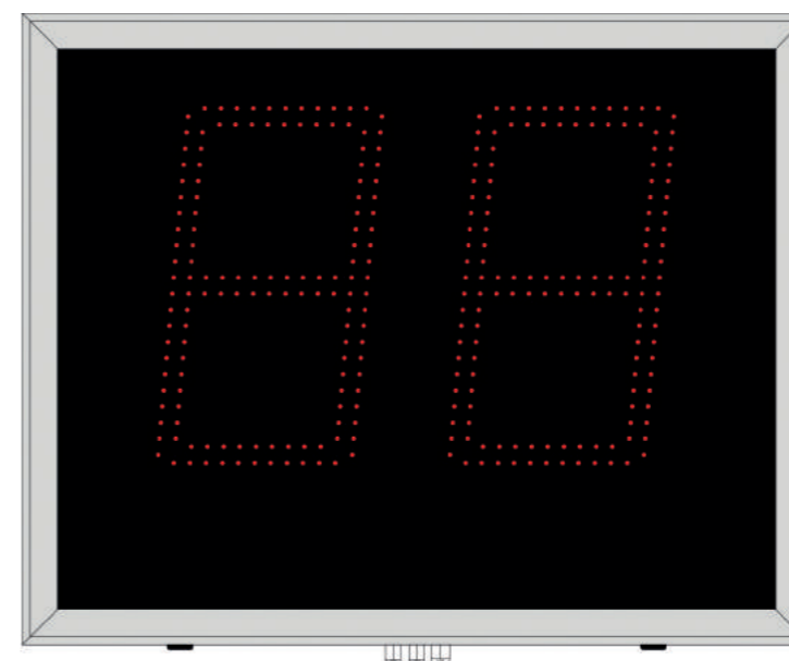
Shot Clock / Play Clock

Die Sekundenanzeigen haben eine Zeichenhöhe von 450mm und somit eine Ableseentfernung von rund 225 Metern. Sie sind als Paar, aber auch einzeln erhältlich.