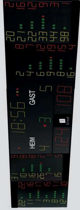
Beispiel: Darstellung Zusatzmodule neben Basismodul