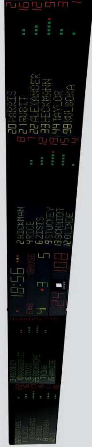
Beispiel: Darstellung Zusatzmodule neben Basismodul