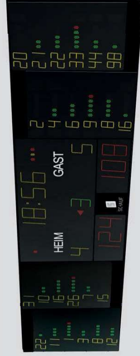
Beispiel: Darstellung Zusatzmodule neben Basismodul